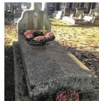
Ancien secrétaire de la Bourse du travail au début du XX e siècle, Henri Gautier a marqué l'histoire syndicale de Saint-Nazaire. Aujourd'hui, une rue porte son nom.

Saint-Nazaire compte six cimetières : Briandais (rue de la Paix), Fontaine-Tuau (route des Forges), Immaculée (rue Baudelaire), Méan-Penhoët (chemin de Bert), Saint-Marc-sur-Mer (rue Marie-Joseph-Molle) et Toutes-Aides (boulevard Victoire-Hugo).