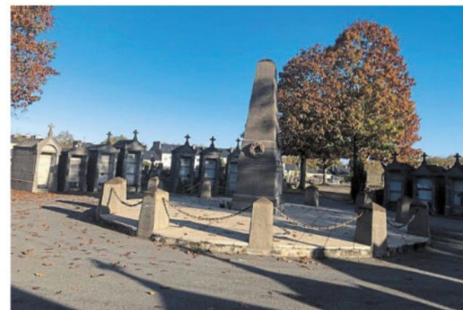
Sous l'ossuaire central, repose les restes de corps sortis des deux cimetières de la vieille ville de Saint-Nazaire, au Petit-Maroc.